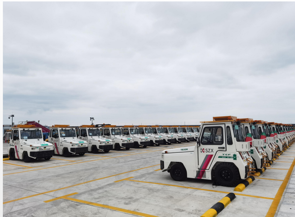
新能源行李牵引车