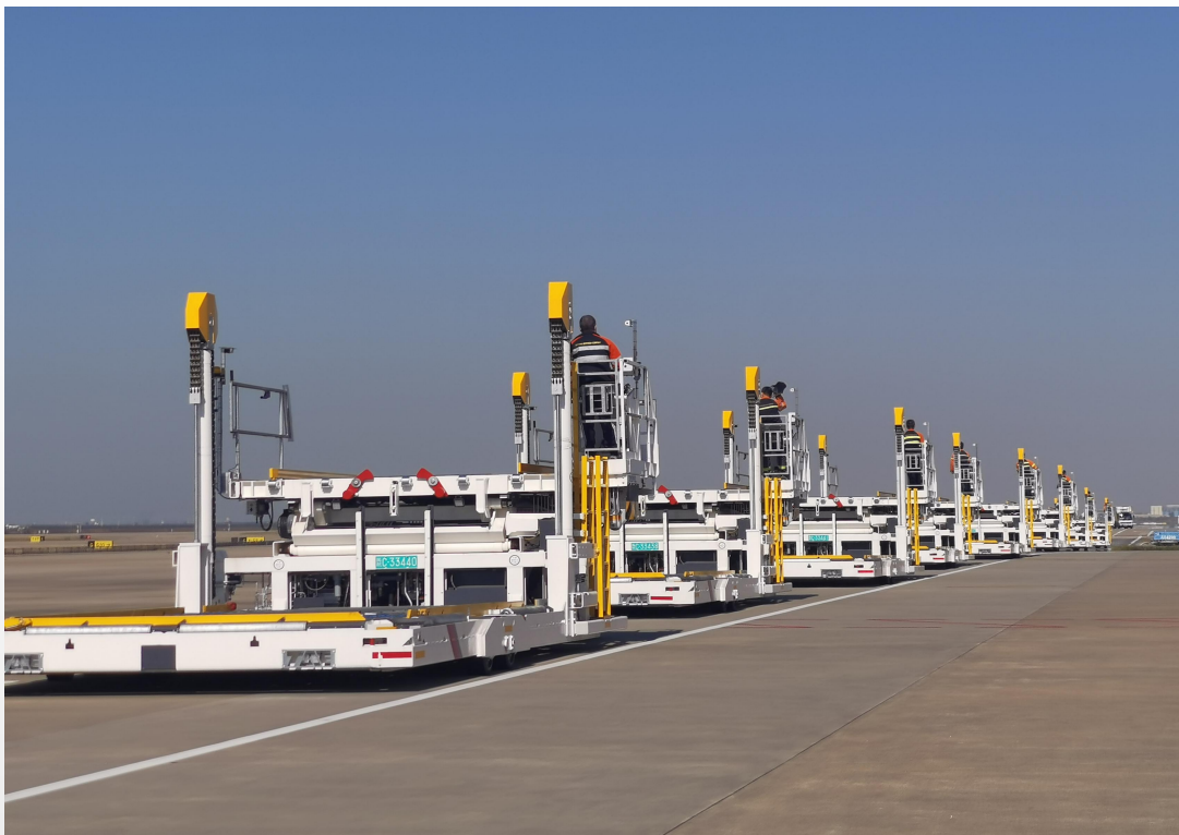
新能源升降平台车